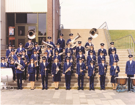
Harmonie jaren zeventig.

Een nieuw decennium met nieuwe kansen én bedreigingen. De rock 'n roll die eind jaren vijftig al voorzichtig van zich had laten horen, brak door. En het zou nooit meer overgaan. Ook in Den Helder ontstond een levendige bandjescultuur. Op het eerste