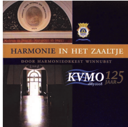
Eerste cd opname van Winnubst.