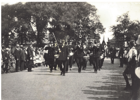
Bij de werfpoort aan de Weststraat.

Zo behaalde de vereniging in 1920 in Hoorn een eerste prijs in de afdeling uitmuntend. Een paar cijfers. In 1921 had Winnubst 715,50 gulden aan kosten, terwijl er 505