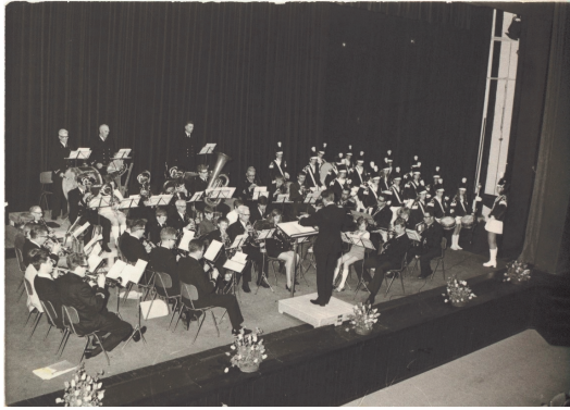
Gezamenlijk optreden harmonie en drumband.

Ook in 1962 deed de nieuwe tijd zich gelden. Onder de grote rivieren werd carnaval gevierd. Dat konden de katholieken boven de Moerdijk dus ook, vonden zij. En zo zag in december 1962 in Hotel Bakker in de Spoorstraat de carnavalsvereniging de Krabbetukkers het levenslicht. Diep in zijn hart zal meneer pastoor er niet blij mee zijn geweest. Feestgedruis leidt de schaapjes alleen maar af van de kudde. Maar à la, het was niet anders. Ook Den