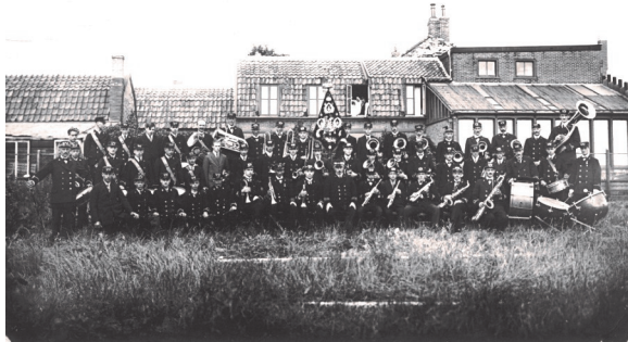
Winnubst voor 1925 als fanfare.