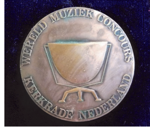
Medaille Kerkrade 1978