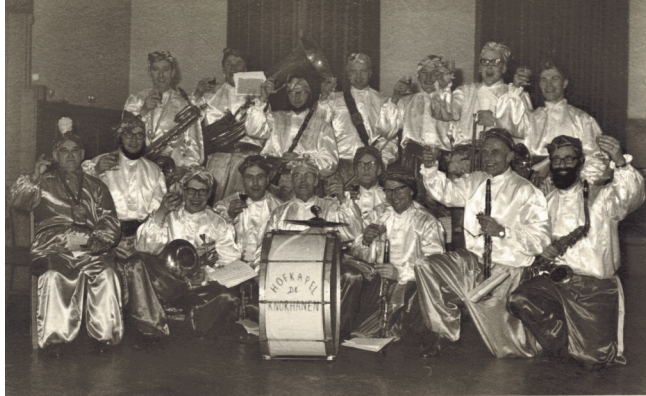
Hofkapel De Knorhanen rond 1965.

uit Zuid-Holland en verder negen fanfares en harmonieën uit Noord-Brabant en Limburg. Winnubst speelde in de ereafde-