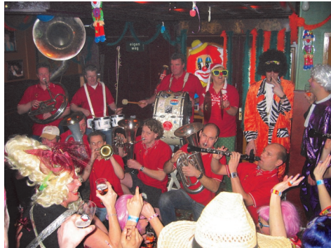
Knorhanen en carnaval zijn synoniem.

In de loop van de jaren is het repertoire van de kapel verbreed met voor ieder wat wils, van carnavalsmuziek, Egerländermuziek tot aan de Nederlandse en buitenlandse evergreens van heden ten dage.