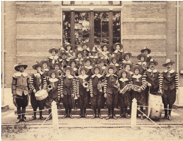
Fanfare Winnubst tijdens de De Ruyterfeesten 1907.

In de winter van 1900 op 1901 presenteerde de nieuwe fanfare zich met een viertal buitenconcerten, op het ijs. In juni 1901 liet Winnubst in Medemblik van