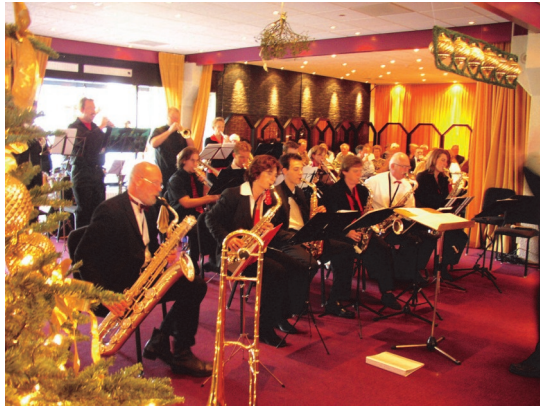
Bigband opgericht in 2005.

een zeer hoog peil gebracht, zorg gedragen voor de uitvoering van een belangrijk deel van de opleidingen en heeft zij blijk gegeven van een grote verbondenheid met onze vereniging. Hiervoor zijn wij, en blijven wij haar dankbaar.’