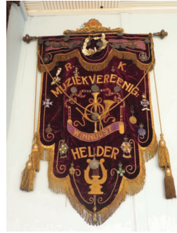
Vaandel anno 2010