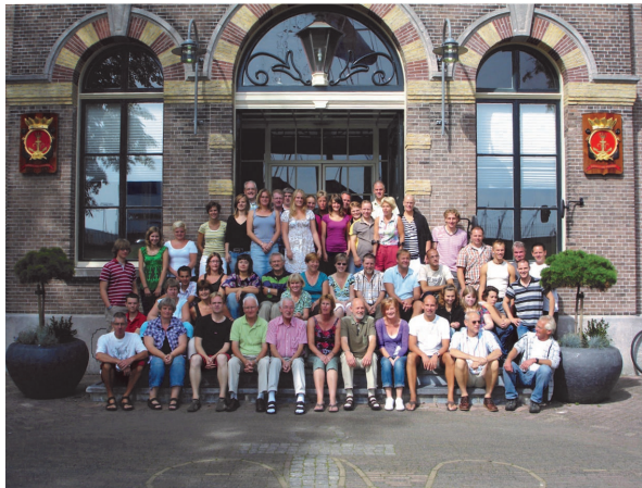
Harmonie voor KIM waar cd werd opgenomen.