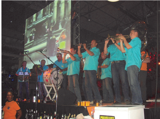
Knorhanen gangmakers op Willemsoord.

Vanuit het orkest was evenwel geen valse noot hoorbaar. Eerder had men last van wegwaaiend partituur, een euvel dat zich vooral in windcity Den Helder doet gevoelen.