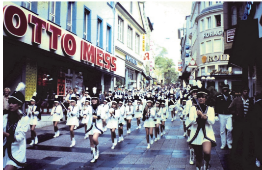
Drumband in jaren zestig opgericht, op de foto in Lüdenscheid, 1981.