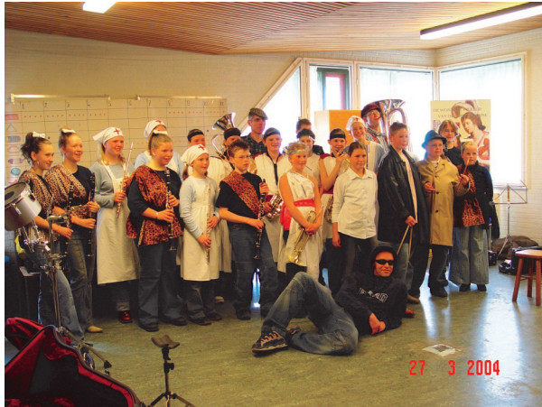
Jongste jeugd op ludiek concours.