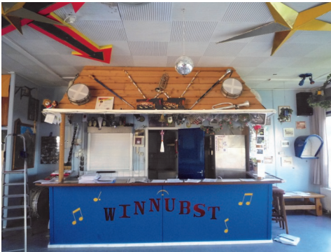
Bar verenigingsgebouw Elzenstraat 36.