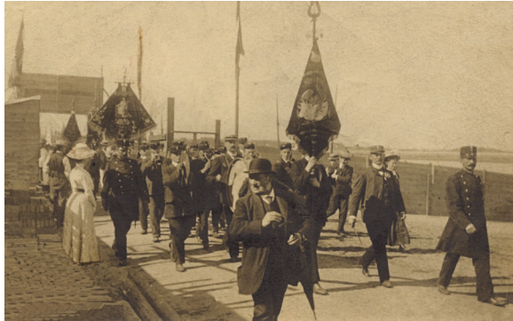
Winnubst in eerste jaren van bestaan.

Uit het verenigingsarchief valt op te maken dat Winnubst in 1903 voor het eerst op concours ging. In Nieuwe Niedorp, waar de fanfare een derde prijs in de wacht sleepte. Tussen 1903 en de jaren daarop volgend zou Winnubst mindere tijden hebben gekend. Leden vertrokken en bedankten en het korps bestond op een gegeven moment uit slechts achttien mannen. Let