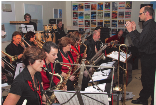
Concert vijfjarig bestaan bigband Frankie.

Waar in de harmonie vaak meer mensen één partij spelen, heeft in de bigband iedereen zijn eigen unieke partij. Jazz heeft zijn ook eigen idioom; exact dezelfde zwarte bolletjes op de bladmuziek moeten in een jazz-orkest heel anders worden geïnterpre-