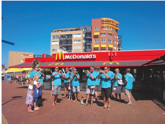
Knorhanen luiden Historisch Weekend 2010 in.

helpen de Knorhanen met het leeghalen der vaten onder het spelen van het laatste deuntje.